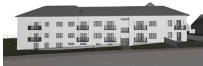
Vizualizácia rekonštrukcie budovy bývalého poľnohospodárskeho učilišťa – Novomestská ulica.

medzi existujúcimi bytovkami na Vršku a obchvatom (oproti hypermarketu TESCO) spolu 102 bytov v štyroch bytových domoch. V troch z nich sa počíta s 26 bytovými jednotkami a ide o jedno a dvojizbové byty. Pre štvrtý bytový dom je naplánovaných 24 bytových jednotiek. Výmery bytov majú spĺňať všetky oficiálne náležitosti týkajúce sa prefinancovania zo Štátneho fondu rozvoja bývania. Po realizácii sa počíta s tým, že pôjde o nájomné byty a po dokončení developerského projektu sa ich majiteľom stane mesto Myjava. Investor i samospráva veria, že takýmto spôsobom by sa aspoň čiastočne vyriešil nedostatok bytov, s ktorým sa mesto potýka. História tohto zámeru sa začala písať ešte v roku 2014, kedy bola na odpredaj predmetného pozemku opakovane vyhlásená verejná súťaž. V tom čase však o pozemok nikto záujem neprejavil. Neskôr sa ozvali dvaja developeri a s jedným z nich vtedajšie vedenie mesta začalo rokovať. Výstupom bola predložená kúpna zmluva, kto-