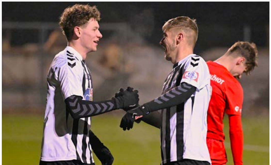
Momentka z prípravného zápasu Spartak Myjava – TJ Sokol Lanžhot, v ktorom Myjava zvíťazila 2 : 0.