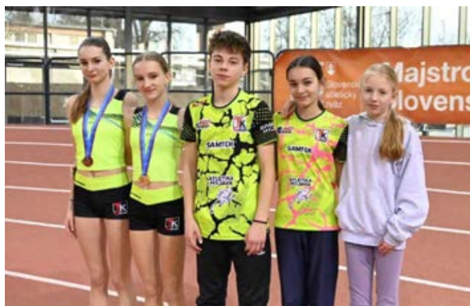
Zástupcovia myjavskej atletiky na Majstrovstvách Slovenska staršieho žiactva.