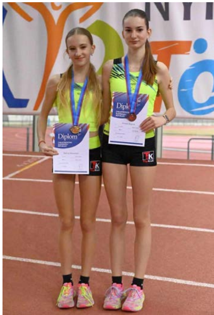
Majstrovské medaile pre myjavské atlétky.

O týždeň neskôr, v sobotu 15. februára 2025, sa takisto Nyí-