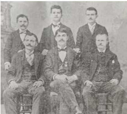
Skupina littlefallských Slovákov z Myjavy v roku 1899.