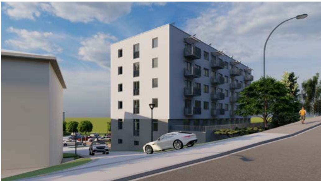
Vizualizácia prestavby bývalého internátu (turistickej ubytovne) na Trokanovej ulici.