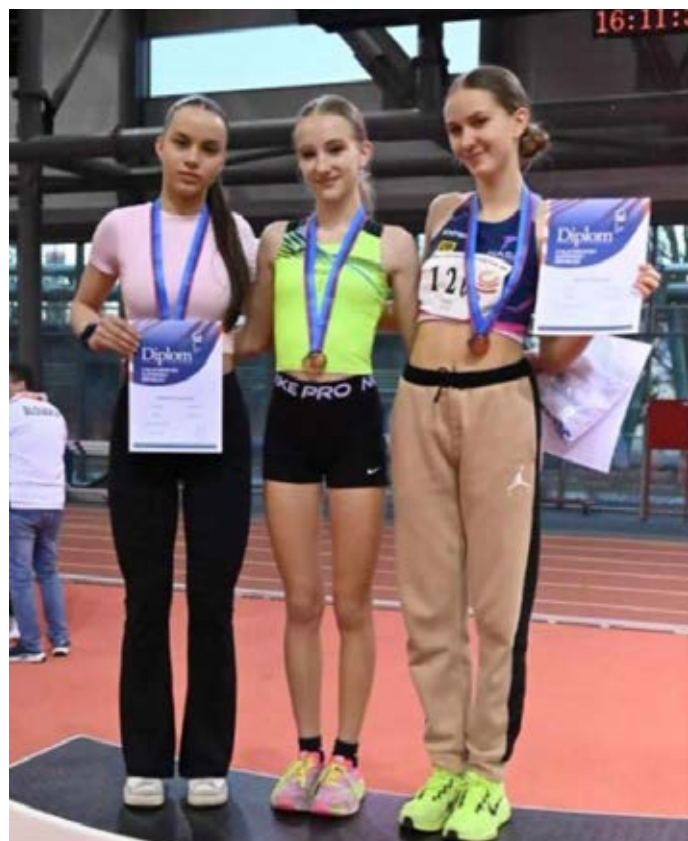
Myjavské atlétky bodovali aj na Majstrovstvách Slovenska dorastencov a dorasteniek.

regyháze konali Halové majstrovstvá SR dorastencov a dorasteniek.