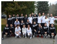
Darovať krv boli aj futbalisti Spartaka Myjava.

Bezplatné darcovstvo krvi – Študentská kvapka krvi 2016 V poradí už 22. študentská kampaň Slovenského Červeného kríža začala tohto roku od 17. do 18. novembra 2016. Počas kampane sa darcovia krvi mohli zapojiť do súťaže o desať cien, ktoré venovala spoločnosť Celimed a Slovenský Červený kríž. Študentská kvapka krvi v HTO NsP Myjava začala vo štvrtok 20. 10. 2016 od 6.00 h.